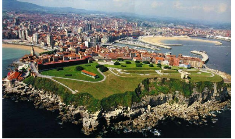
Cerro de Santa Catalina

Al lado del palacio está la capilla de Nuestra Señora de los Remedios, donde reposan los restos de Jovellanos. Anexo queda también el antiguo Hospital de Peregrinos, hoy restaurante.