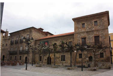
Palacio de Jovellanos

M a V de 9:30 a 14 y 17 a 19:30. S, D y festivos: 10 a 14 y 17 a 19:30. Gratuito. Audioguía: 1,60€