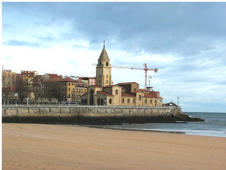
Iglesia de San Pedro

Al final del parque se encuentra el estadio de fútbol del Molinón. Al otro lado del río podemos visitar el etnográfico Museo del Pueblo de Asturias .